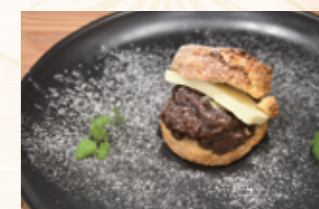
あんバタースコーン

《DESSERT》 11時~20時 あんバタースコーン 450円 門真れんこんパウダーを生地に練り こんだ当店オリジナルスコーンに、 たっぷりの粒あんとバターを挟んだ 贅沢な一品です。