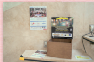
ルミエールホールでの設置の様子

<主催> パナソニック株式会社 <共催> NPO法人トイボックス <設置場所> ・門真市民プラザ ・市立公民館 ・ルミエールホール ※ISBNコード(バーコード)のついた書籍、 CD・DVDに限ります。 ※ルミエールは1月中旬までの 期間限定設置の予定です。