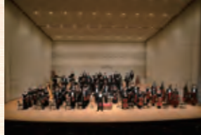
関西フィルハーモニー管弦楽団

ルミエールホール 大ホール 一般:4,000円、門真市民割:3,600円 25歳以下の学生:1,500円 チケットは関西フィル事務局、ルミエールホール各種プレイガイドにて販売中。 ※未就学児入場不可