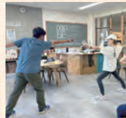
マンガ・ゲームの会の様子

TBにやってくる中高生たちの“やりたいこと”を形にするイベント「〇〇〇の会」。中高生たちの想いを具体的なものにすべく、オトナスタッフたちも一緒になって企画しています。最近では「マンガ・ゲームの会」や「カメラの会」などが続々発足！9月からは新たに「鉄道を語ろう会」もスタートします。みんな、気軽に〇〇〇の会に参加してね！