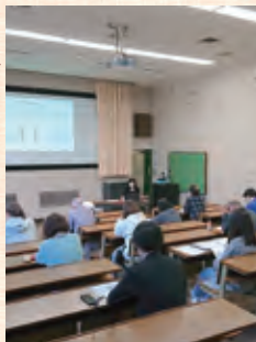
過去の養成講座の様子

対 18歳以上の方 ¥ 無料 申 9月1日(金)から9月30日(土)までに市民プラザホームページから申込み