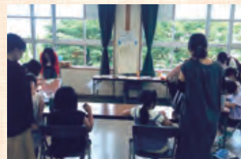
「粘土のミニチュアフードのストラップ作り」子どもたちも楽しそうに取り組む様子

初の試みとなった今回のサマースクールでは、ワークショップ、ゲームで学ぶ防災、歴史、お金など幅広いジャンルの11講座を実施。夏休み中の子ども向けの講座が中心でしたが、中には夏休みの自由研究に役立つ内容もあったりと、満足度の高い内容でした。また大人向けの講座でも、地元門真の歴史について改めて学べる機会になるなど、新たな発見が多いサマースクールとなりました。